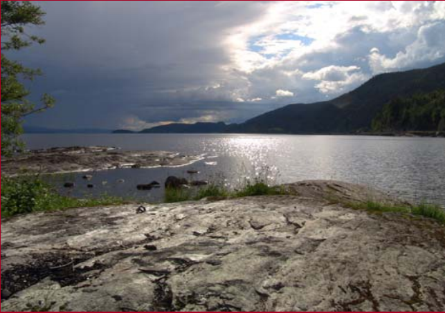
Uitzicht op Snåså vatnet