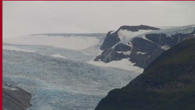
Swart Isen gletsjer