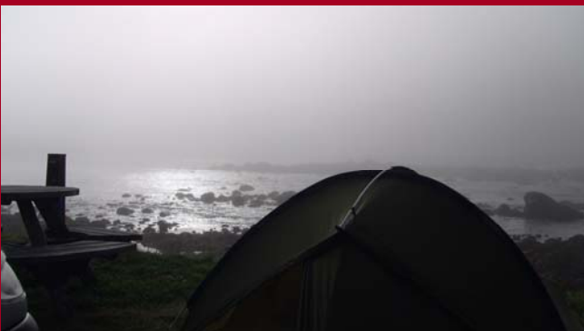
Ochtendnevel schitterende dag