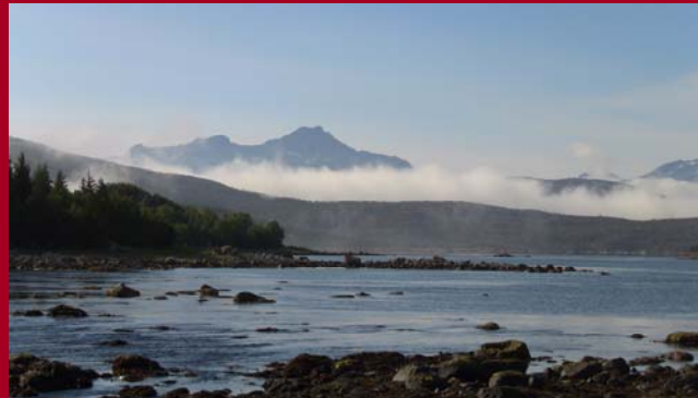
Ochtendgloren in Hameroy