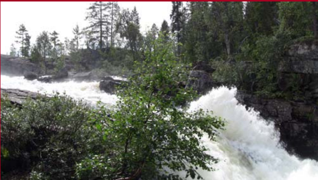
Uitloop van Maja vatnet